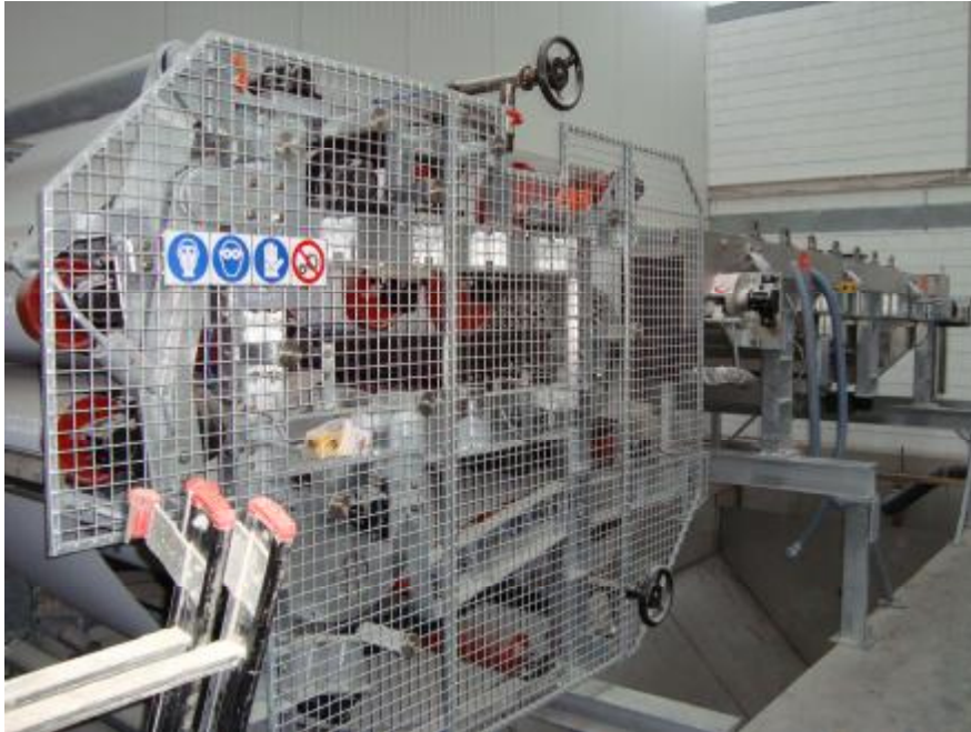
Ontwateringstafel en zeefbandpers.

De dunne fractie wordt opgeslagen in kelders en gaat pas daarna naar de Reversed Osmose filtratie. De vlokken gaan via een ontwateringstafel naar de zeefbandpers, en daarna naar de peddeldroger en dan naar de nadroger (wervelbeddroger).